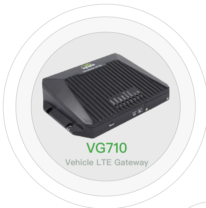
VG710 Vehicle LTE Gateway